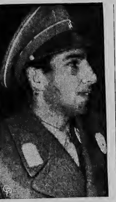
PRINCE ALI REZA (above), 32, younger brother of Shah Mohammed Reza Pahlavi, disappeared on a plane flight between the Iranian capital of Tehran and the Caspian Sea. Ground crews and search planes are combing over the area hoping to find trace of the heir presumptive to the throne of Iran. An earlier report that the Prince was safe was denied by officials of Iran.

dat opvalt in het mozaiek der Nederlandse gewesten en zij verdedigt het streekbelang, vaak met uitmuntende resultaten. Tenslotte nog één opmerking: het gaat er ten aanzien van de oriënterende taak van de pers - en dat geldt zowel voor de landelijke als voor de regionale bladen - zeker niet alleen om de openbare mening te VORMEN. Het is zelfs de vraag of dat nodig en mogelijk is..... Nee, van belang is ook, dat de stem van de openbare mening wordt GEHOORD. De Overheid leert bijvoorbeeld door bepaalde publicaties, hoe haar onderzaten over haar beleid denken en mogelijk is dit van invloed op haar bestuurlijk handelen. In de vertegenwoordigende lichamen wordt de pers vaak geciteerd als de vertegenwoordigster van de openbare mening. Ook hier dus een invloedsfactor, of zo men wil een „machtsfactor“. Het „wervende“ woord moge gedevalueerd zijn, het „openbare“ woord heeft, wanneer dit van onverdachte zijde komt, nog niets van zijn kracht ingeboet. Dus toch Koningin der aarde? Hopelijk worden deze flonkeringen van haar scepter eveneens wetenschappelijk onder de loupe genomen, zodat ook in dit opzicht de „officiële waarheid“ op de werkelijkheid wordt getoetst. G. A. DE KOK.